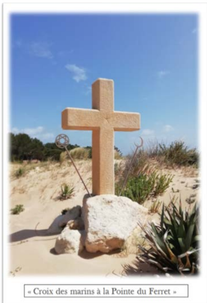
« Croix des marins à la Pointe du Ferret »

Si tu la suis, tu ne dévies pas, Si tu la pries, tu ne faiblis pas. Tu ne crains rien, elle est avec toi, Et jusqu'au port, elle te guidera.